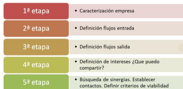
Figura 2. Metodología del proyecto INSYLAY

Por el contrario, el proyecto INSYLAY, se basa en una plataforma web que contemplará una serie de recursos que van desde la ayuda a la búsqueda y análisis de posibles sinergias en las etapas de producción, transporte y suministro, hasta la posibilidad de la creación de un vivero de proyectos de iniciativas relacionadas con la simbiosis industrial.